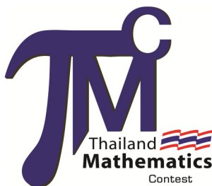
泰國數學競賽組委會 （泰國）