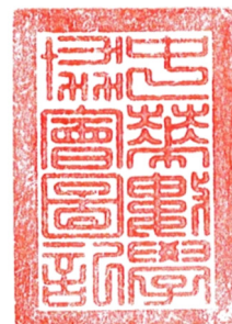
中華數學協會 （中華台北）