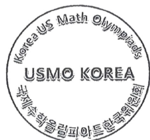
美國數學奧林匹克學 會 韓國分會（韓國）